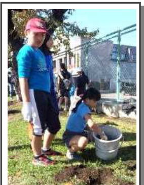
桜保存プロジェクト