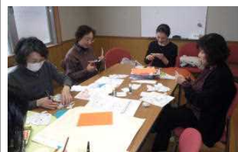
図書館ボランティア