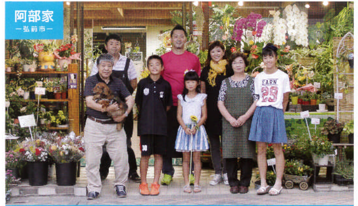
お花のように元気いっぱい! 明るい8人家族!