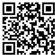
申込みフォーム QRコード

弘前市旅館ホテル組合 http://www.hiroyado.com TEL 0172-34-2657 FAX 0172-34-2714